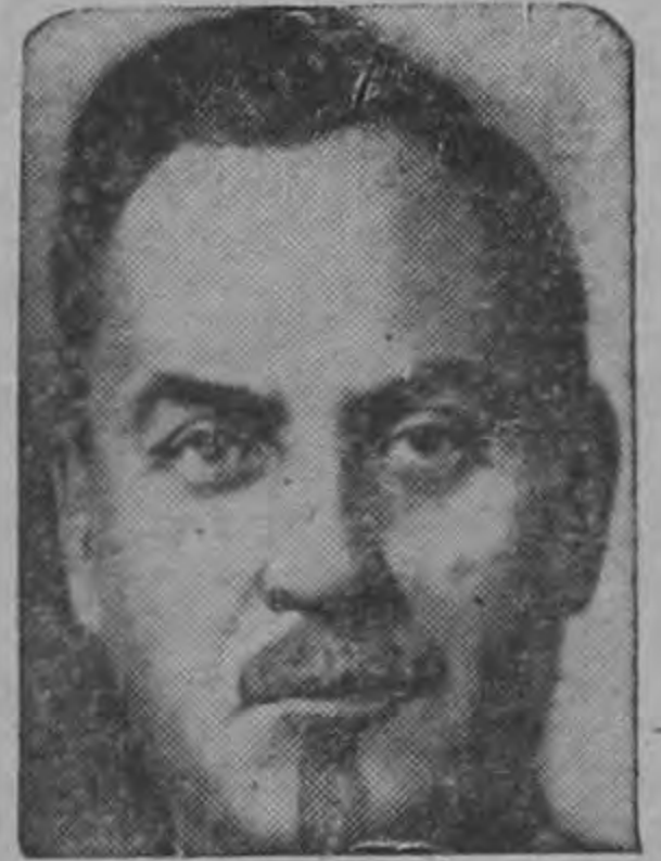
Premier NICOLAI BULGANIN