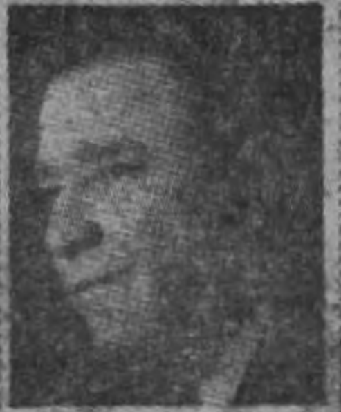
DON OTILIO ULATE.

no, el Gobierno y yo a mí, porque no se puede establecer una confusión para desorientar en el estado de marzabón lo que se ha hecho en poder por un momento, porque ya no soy el representante de un grupo sino el representante de una idea que míster por todas las contingencias.