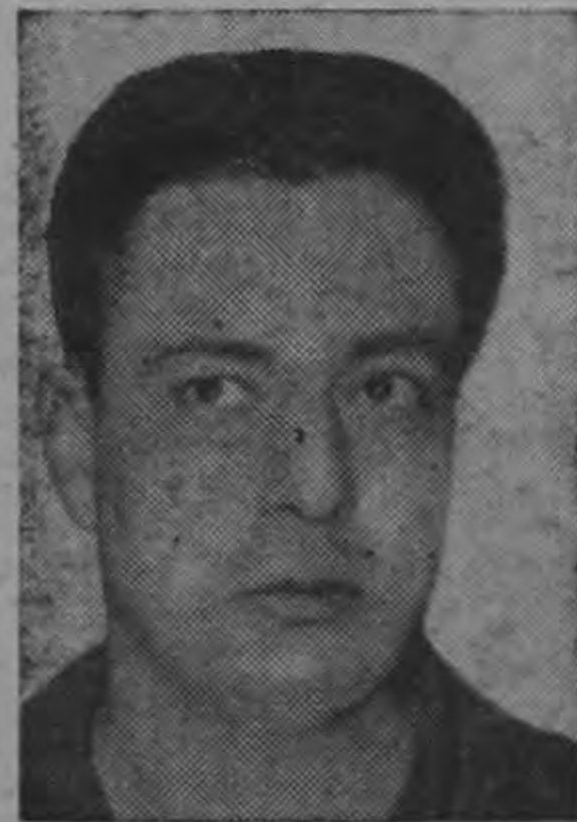
PEDRO JOAQUIN CHAMORRO

La Asociación de Periodistas de Guatemala solicitó cablegráficamente a la SIP que exija la libertad del periodista secuestrado para quien el fiscal nicaragüense pidió pena de muerte, acusándolo falsamente de complicidad en atentado contra Somoza.