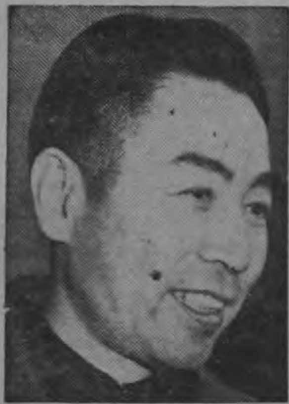
PREMIER CHOU EN LAI

Demandan el pago de indemnizaciones para Egipto de los gobiernos de Inglaterra, Francia e Israel por las campañas agresivas contra el Canal de Suez y la Península del Sinaí. — (TEXTO EN PAGINA 8) —